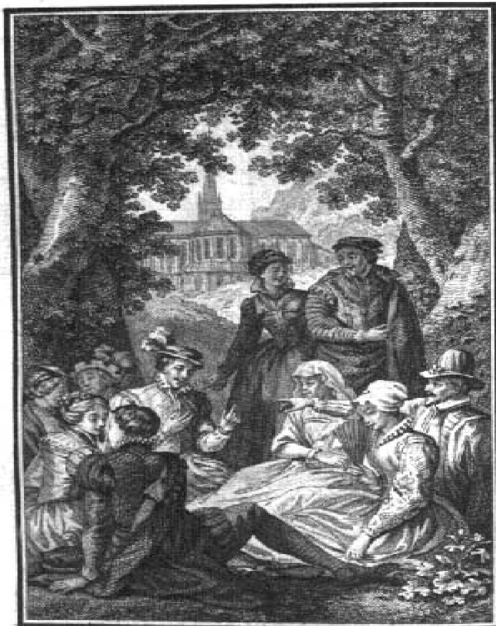
S. Freudenberg. inv.