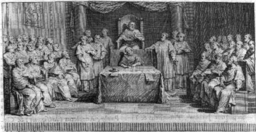
Apostolicae sedis ad consultationes Orientis et Occidentis responsa ex. Hætericæ epistolæ et ad apostolicæ