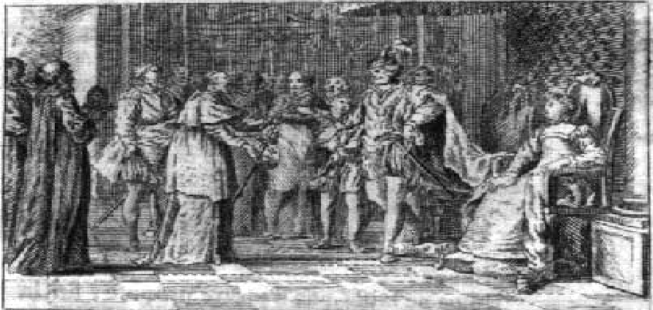
Le Cardinal Caraffe présente à Henry second au nom du Pape, signé et le sceau.