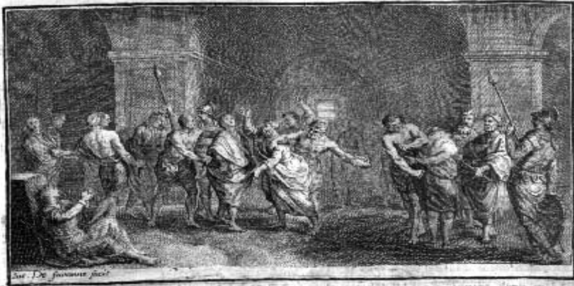
San. De. Johannes fecit