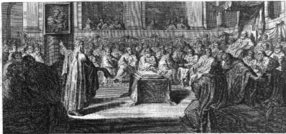
De Sion exhibit lex, et verbum Domini de Jerusalem. 164. 163.