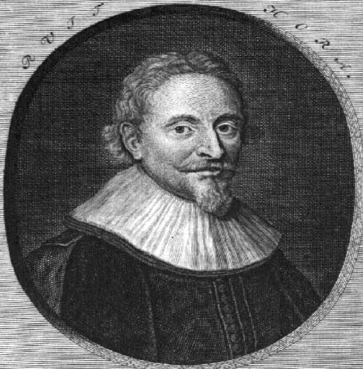
HUGO GROTIUS, Regine Regnique Suedici Consiliarius eorundemque ad Regem Christianissimum Legatus ordinarius, quondam Syndicus Rotterodamensis, ejusdemque Urbis in Conventu Ordinum Hollandiae et Westfrisiae Delegatus.