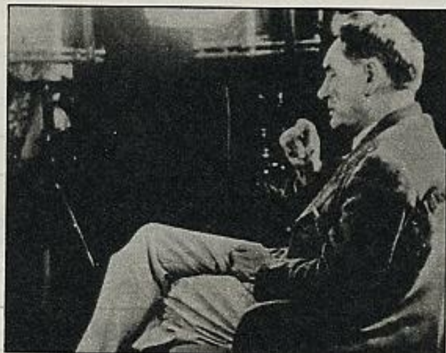
V. I. Pudovkin, autor cinematográfico de "La madre", que se repone —después de muchísimos años— en Madrid.

Domingo 5.—11,30: "MACBETH" (Roman Polanski). 16,00: "CUL-DE-SAC" (Roman Polanski, 1966). 18,00: "CHINATOWN". 20,15: "¿QUE?". 22,15: "NUMBER SEVENTEEN".