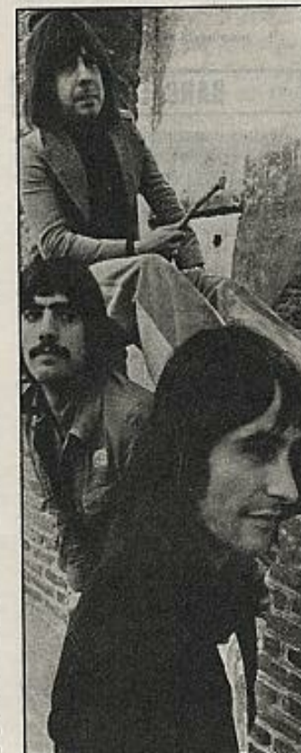
Triana actúa en Gijón y Compostela.

LA BULLONERA actúa de jueves a do- mingo en el Valencià Cinema, a las 22,45