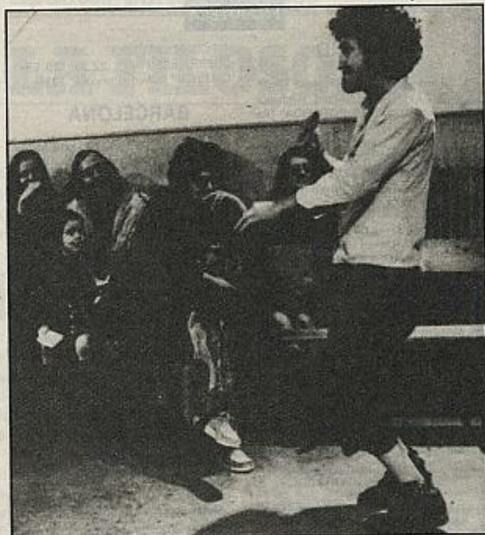
"Misterio Bulo", de Dario Fo, por el Teatro Ay Ay Ay, Madrid.