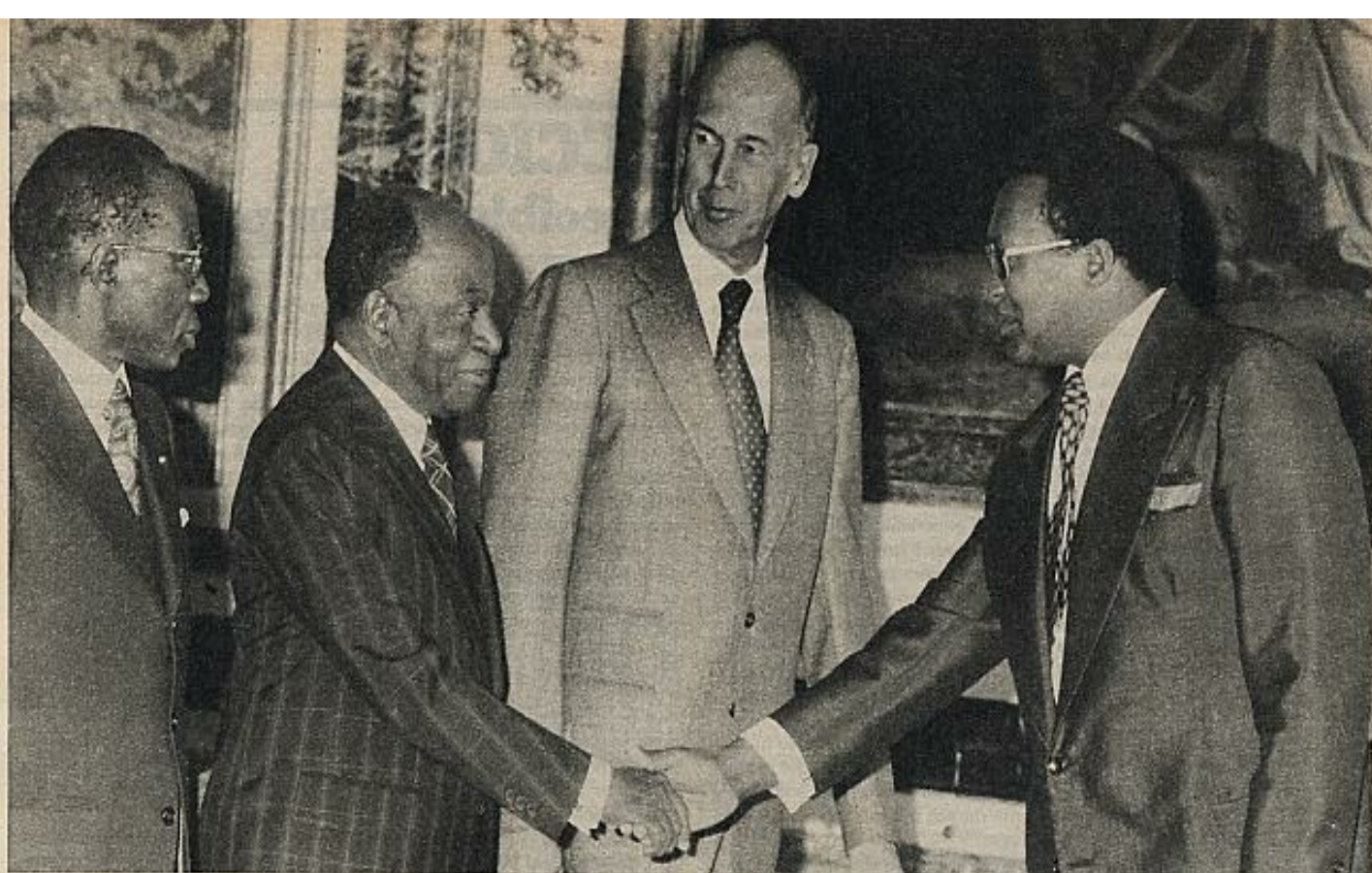
Giscard pretende sentar las bases de lo que se ha llamado una "multinacional militar". En la foto, durante la cumbre franco-africana en París, entre Leopold Senghor, del Senegal, y Houphouët-Boigny, de la Costa de Marfil.