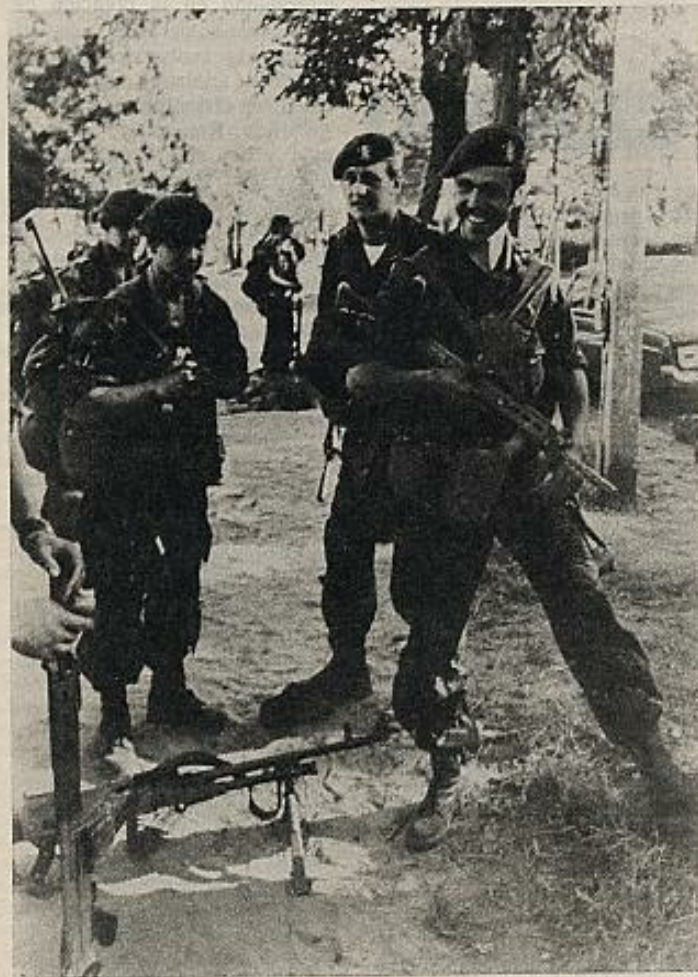
El desorden, el caos, las guerras africanas no son sino consecuencia de una explotación, en la que participan tanto USA como Francia, Bélgica o la RFA. En la foto: racistas franceses y belgas en Kolwezi.

Pero, por encima de estas querrelas, pasa otro tema: la neutralización de un independentismo africano. La guerra abierta a los "rebeldes": con o sin Mobutu, es lo de menos. Mobutu trata de evitar ser despeñado, no quiere que su país se convierta en una "democracia controlada", donde no tenga él el papel principal. Pero los Estados Unidos, Francia y Bélgica y, sin duda, la OTAN no pierden demasiado tiempo en estas disputas pequeñas; lo importante es que el Zaire quede bajo control y que no se pierda el de otros países africanos; si se puede recuperar Angola, mejor aún. Es una cuestión directa de explotación. ■