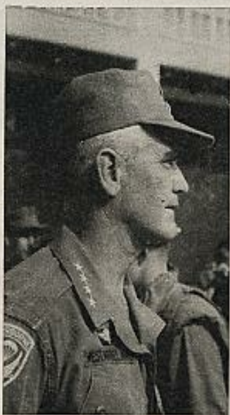
El general Westmoreland en su época del Vietnam; posteriormente, jefe del Estado Mayor del US Army.

a) Debido a su atraso, a su origen reciente o ambos factores a la vez, los regímenes contra los que se dirige la contrainsurrección sufren generalmente de desarraigo o inestabilidad. Sus dirigentes políticos carecen con frecuencia de experiencia, son antagonísticos entre sí y están corrompidos. Cuando surgen líderes excepcionales, sus esfuerzos se ven con frecuencia frustrados por una maquinaria gubernamental inadaptada a las con-