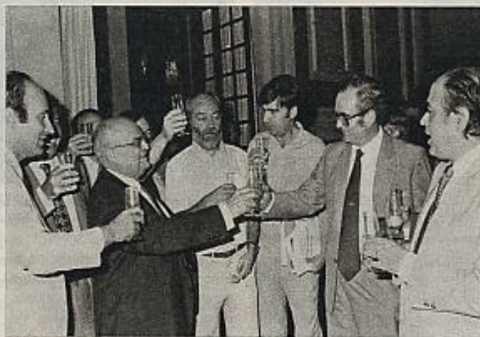
Los parlamentarios catalanes celebran la aprobación del Estatuto, por la Ponencia Constitucional. Un Estatuto que es superior al de 1932 y no sustancialmente inferior al elaborado por los parlamentarios en Sau.

¿Qué significado tenía aquel breve editorial acompañado de un discretísimo título de portada en el que se leía "Acord sobre el Estatut", lejos por tanto de cualquier entusiasmo? Significaba un reflejo de una actitud posible