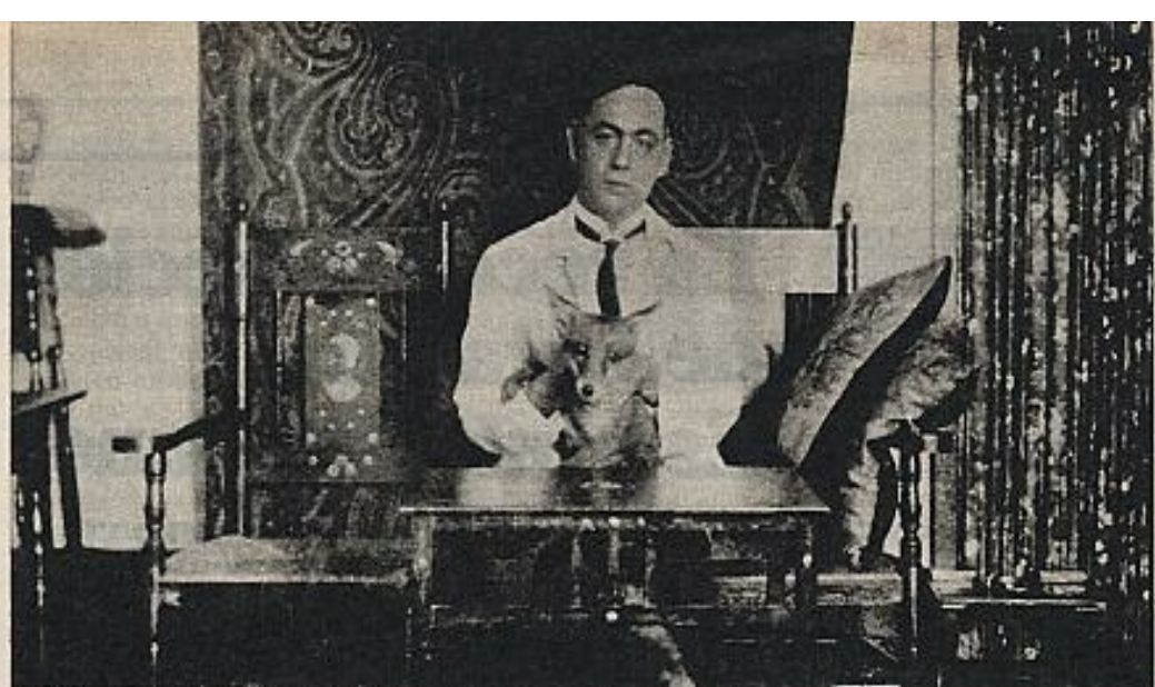
Blas Infante, en Isla Cristina, año 1927, con el zorro que salvó de las iras populares, porque se comía las gallinas de San Silvestre, y lo llevó a su casa.

Rafael Escuredo, que además es presidente de la Junta de Andalucía? Si Rafael Escuredo se declara nacionalista, y en él los andaluces deben sentirse unidos, como se dijo en Casares, ¿cómo reaccionará cuando el Estatuto no recoja el término nacionalidad, que él mismo defiende? El presidente de la Junta de Andalucía deberá poner freno a esta polémica interna de su partido (un sector del PSOE se ha declarado nacionalista) y decidirse, si quiere seguir por el buen camino que ha iniciado, por la política que su partido quiere aplicar al Estatuto o la política que él ya ha emprendido, y con buen pie, si es que sabe sobrepasar el obstáculo Rodríguez de la Borbolla.