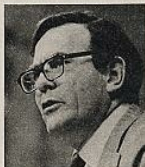
Ramón Tamames ("España, 1931-1975").

"CANTO DE SIEMPRE", de Rafael Alberti. Seleccionados Austral.