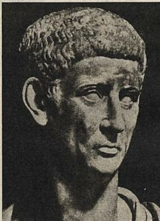
De izquierda a derecha y de arriba a abajo, los cuatro primeros Emperadores romanos: Octavio Augusto, Tiberio, Calígula y Claudio ("Yo, Claudio Druso Nerón Germánico...").

conspirativas y la fricción permanente entre la fuerza de las armas y el espíritu de las leyes, ya que un general triunfante allende las fronteras del Imperio era siempre una amenaza para el orden establecido.