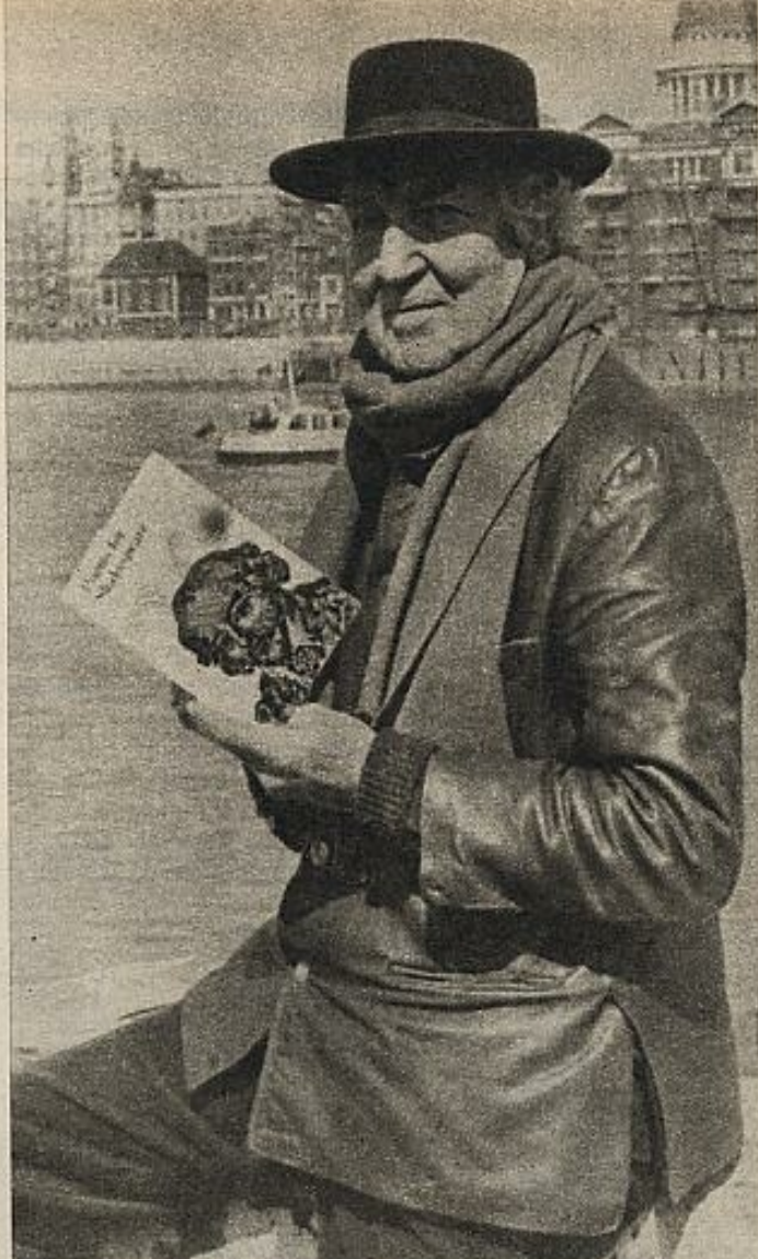
Robert Graves, un compuesto de sensibilidad erudita y fantasía.

Se le reprochó a Graves en su momento que para la documenta-