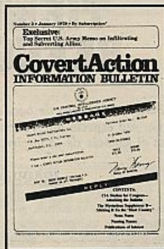
Portada del número de "Covert Action", el boletín de los veteranos o "disidentes" de la CIA, donde se ha publicado la historia del ya famoso FM 3031 Supplement B.

La toma de postura del Pentágono obliga, a su vez, a que la Cámara de Representantes investigue a través de su "Comité de Inteligencia" (Información y espionaje) la veracidad o falsedad del documento. Es la palabra del Pentágono —juez y parte— contra la