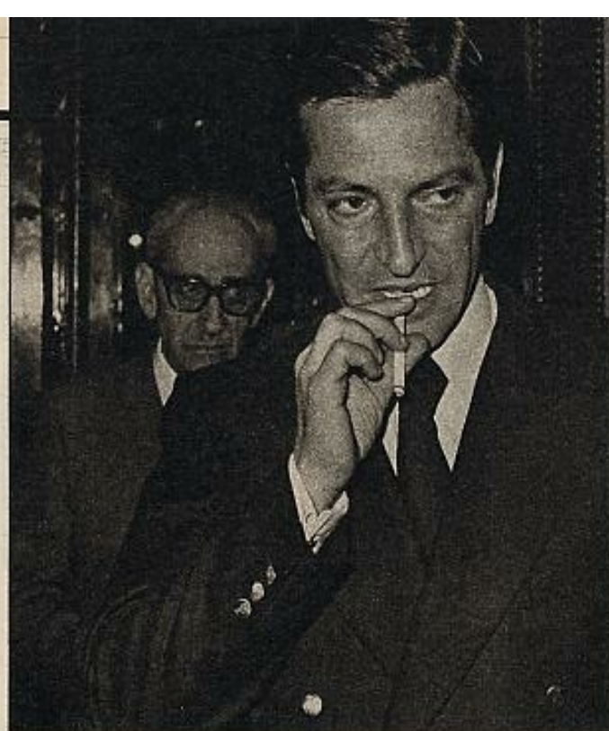
El presidente y su general de la Guardia.

rios y beneficiarios. No siempre coinciden y por eso no pueden equipararse las tarifas con los costes. Los beneficiarios (por ejemplo, dueños de solares por donde vaya a pasar una nueva línea de transportes) tienen también que contribuir a la financiación.