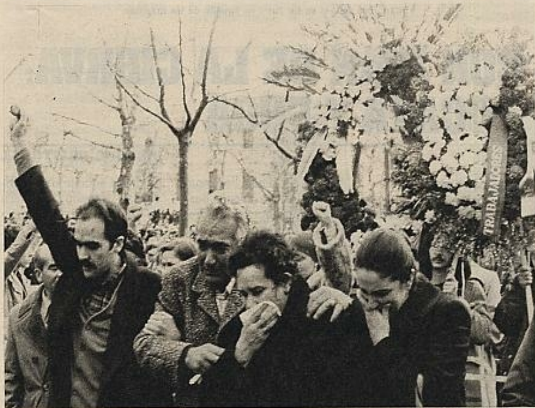
Un momento del entierro de los abogados laboristas, el 26 de enero de 1977.

consta con seguridad que han pasado semanas y semanas en celdas.