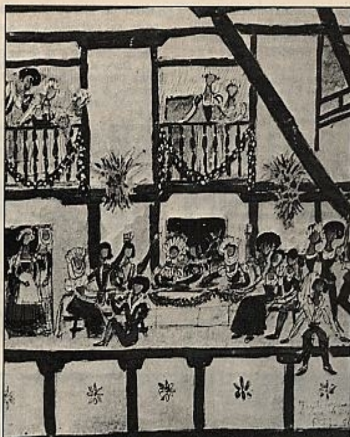
Programa del Festival de Teatro Clásico de Almagro.