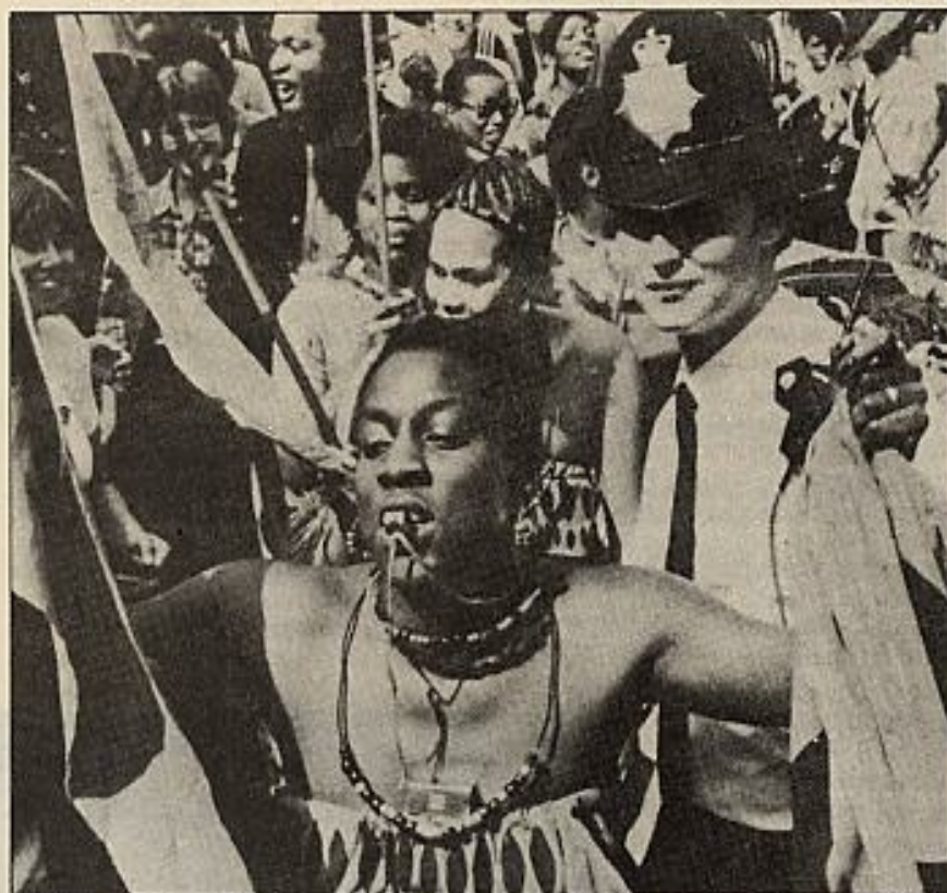
«El Carnaval caribeño de Notting Hill fue simplemente una gran verbena con mucho reggae y soca, mucha marihuana y mucho alcohol, pero no estallaron los molotov ni volaron los adoquines como en abril y julio pasado.»

Si yo, que no tenía voz ni voto, hubiera de elegir la calle que más me gustó, quizá me decidiría, sin embargo, por la Calle Nochebuena, en la Colonia Moscardó, una calle pequeña con una sola entrada, de casas de tres pisos. En la Colonia, como en todo el barrio de Usera —ni siquiera el índice de paro que en estos días llega allí al 30 por ciento parecía haber disuadido a los vecinos— las calles estaban bellamente adornadas. Pero las calles anchas ofrecen mayores dificultades a la hora de tender la cadeneta de papel hecha a mano o las guirnaldas. El tamaño de la calle Nochebuena resultaba ideal para hacer lucir con brillos de fiesta el trabajo de los vecinos. Abanicos de papel en las ventanas, mantones en las fachadas, ristas de cristal suspendidas que se mecían levemente al viento con reflejos tornasolados. Salió el vecino que hacía las veces de presidente y, mientras tomábamos con él la limonada de la hospitalidad, nos mostró con delectación, con orgullo casi «nacionalista», su minúscula patria engalanada. ■ L. C.