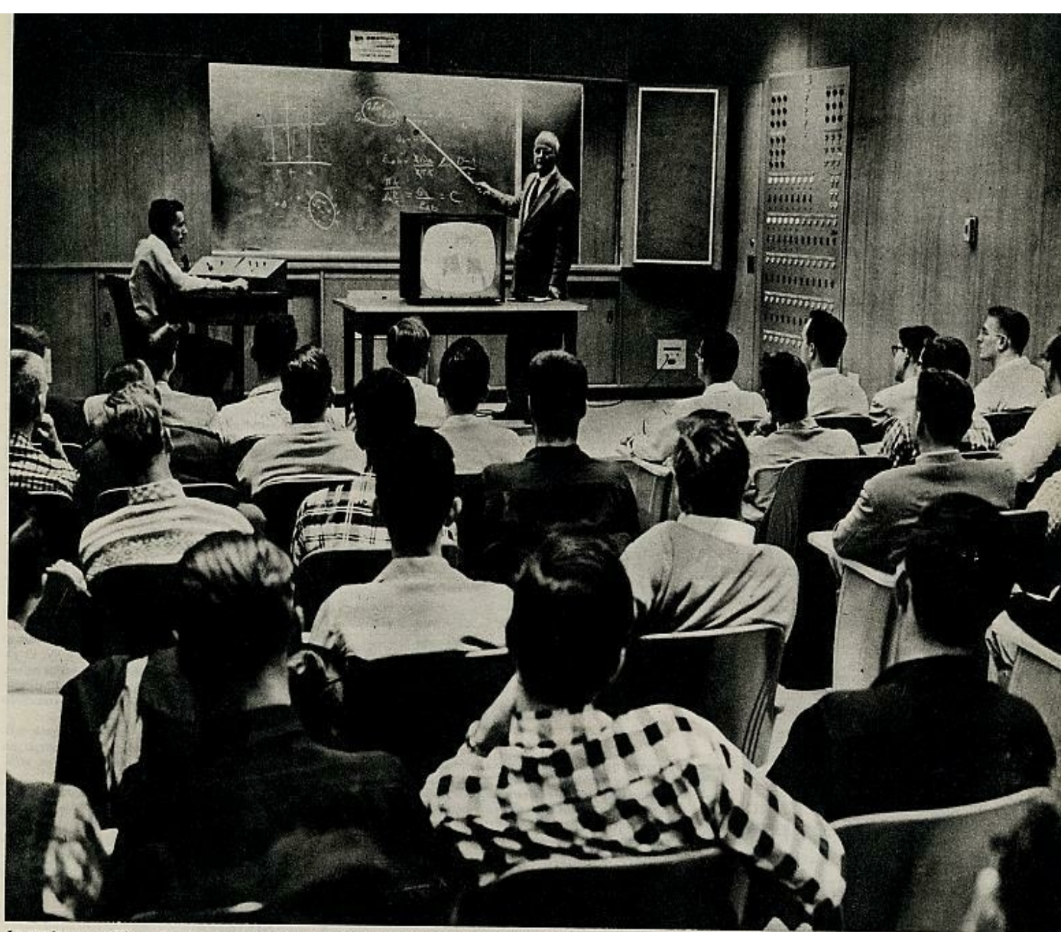
La enseñanza por TV completa la preparación. Si hubiera de hacerse con los métodos tradicionales se necesitarían más de ciento treinta y cinco maestros para suplir esta labor.