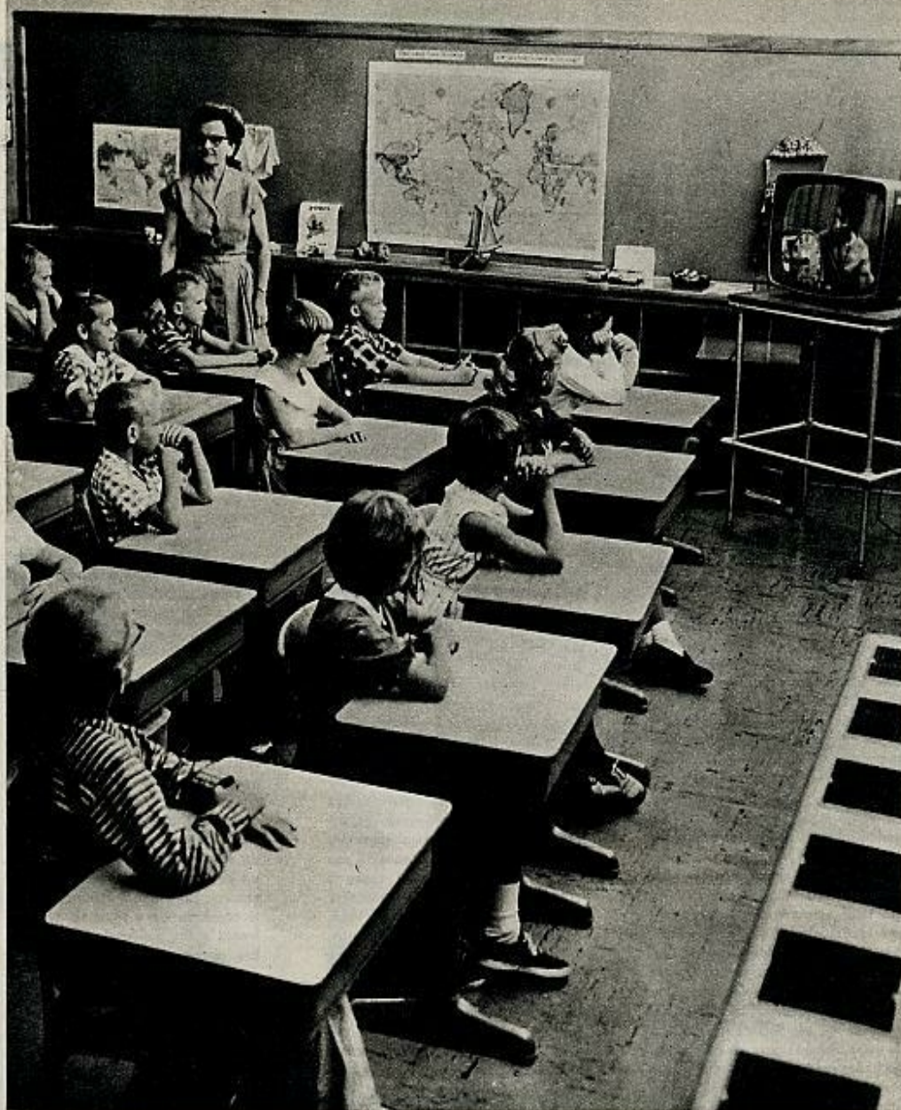
En Hagerstown (Maryland), 18.200 alumnos reciben por lo menos un mínimo de un período diario de enseñanza por televisión.

● Para celebrar la festividad de Santa Clara, patrona de la TV., la Eurovisión ha retransmitido una misa oficiada en Asís. Es una fecha festejada por todos y la TV. E. dio en imágenes la ceremonia religiosa. Cuando llega un día señalado, todas las televisiones del mundo —y especialmente las europeas—, dan a sus espectadores un programa especial conmemorativo. Es como un «número» extraordinario. Nuestra TV. no ha celebrado mucho, que digamos, su programa 2.000. Si no llega a ser por la coincidencia con el Telstar, ni nos enteramos. Esa sobriedad, que aplicada a tantas cosas es digna de aplausos, parece demasiado rigurosa cuando se trata de destacar fechas de todos —los que hacen la TV. y quienes la ven— tenemos por buenas.