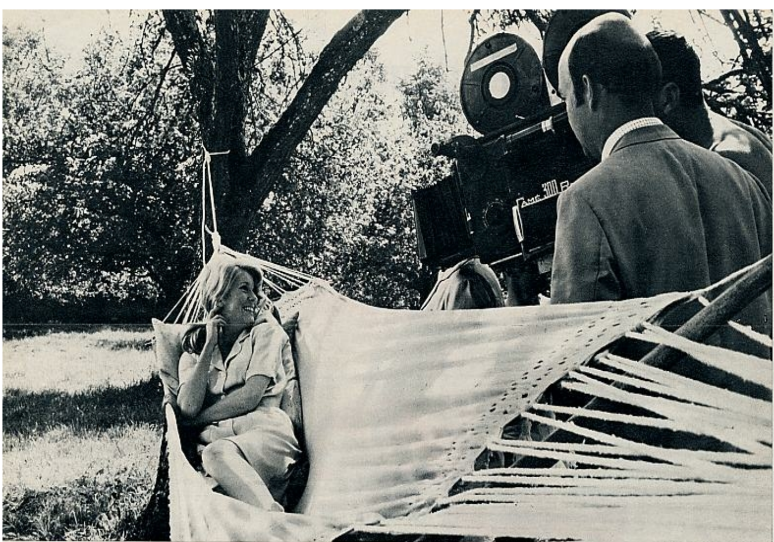
De su unión con Roger Vadim, Catherine Deneuve tuvo un hijo, que ahora cuenta dos años. Consiguió popularidad internacional con su papel en «Los paraguas de Cherburgo», del realizador francés Jacques Demy.