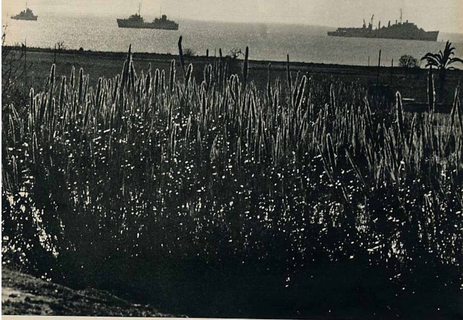
campamento, salen escuadras de hombres ranas. El contacto entre la Marina y los hombres de tierra es muy estrecho y constante... Cada descubrimiento, cuenta.

Al fondo, contamos ya las unidades de la flota americana estacionada frente a Palomares. Primeros guardia civiles. Autobuses militares repletos de soldados. Vamos de un lado a otro, sin que, por el momento, nadie nos lo impida. Al acercarnos a la costa, un grupo de civiles nos encamina hacia el campamento. Hay que pedir permiso en la oficina de prensa, montada en un autobús. Nos vamos para allá. Coches. Uniformes. Casitas cerradas, y en la misma entrada del campamento, al lado de un viejo torreón desmochado, la tienda de campaña levantada para atender las reclamaciones de los afectados por el desastre.