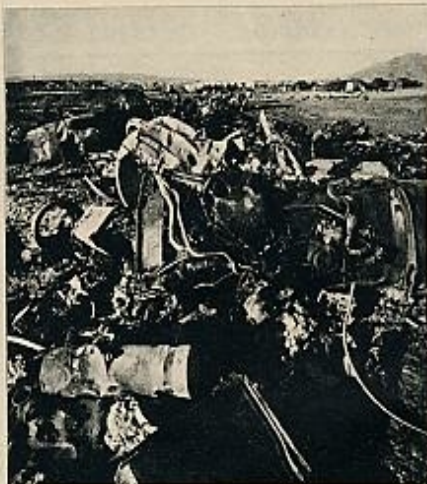
Los restos de los aviones americanos son trasladados al depósito establecido unos metros más allá del campamento militar de Palomares.

que dicen los periódicos de Madrid y ellos dicen que no hay peligro. Esto es muy tranquilo.