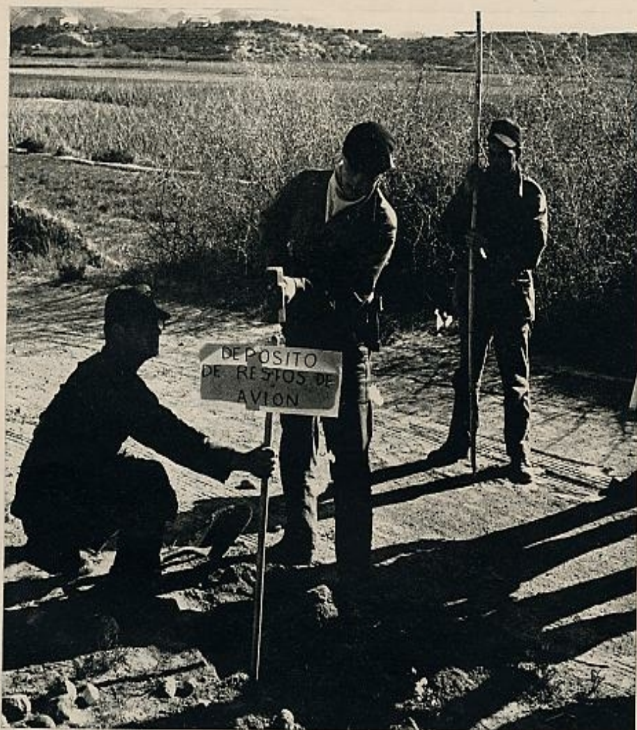
Toda la tierra que se extiende alrededor de Palomares está siendo minuciosamente rastreada. Tropas del campamento levantado junto a la playa buscan sin descanso los restos de los aviones y de su carga.