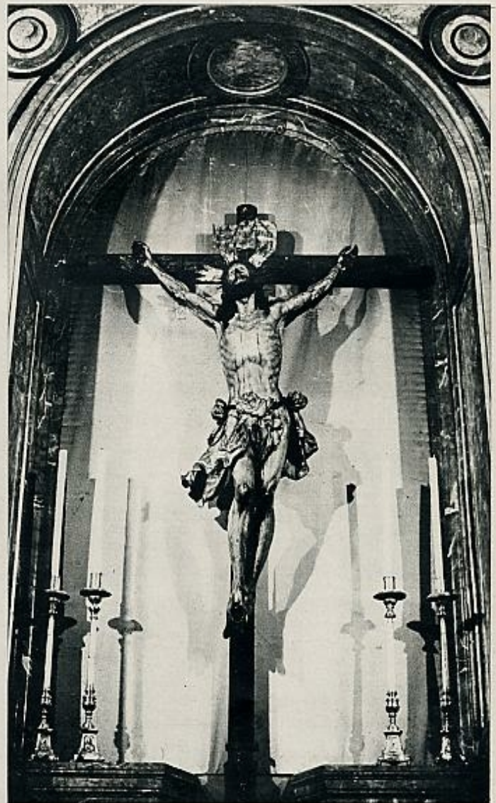
El Cristo de Triana, el Cachorro. La Iglesia, de paredes desnudas, evoca las noches de Semana Santa, en que surgen las saetas, canto donde la queja se hace pública.