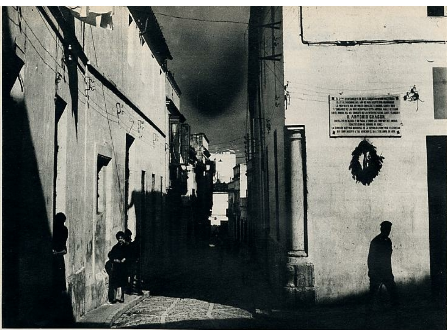
La casa, con un indudable señorío, en la que vivió Antonio Chacón. La placa dice: «El Excmo. Ayuntamiento de esta Ciudad... aceptó por unanimidad rotular esta antigua Calle de Cazón con el nombre del más eminente de los intérpretes del canto flamenco, don Antonio Chacón». Abajo, en la humildísima casa en que nació Manuel Torre, la placa, colocada en 1959, declara: ... «Manuel Torre (Niño de Jerez), célebre intérprete del canto jondo y portentoso creador del más difícil estilo de seguiriyas».