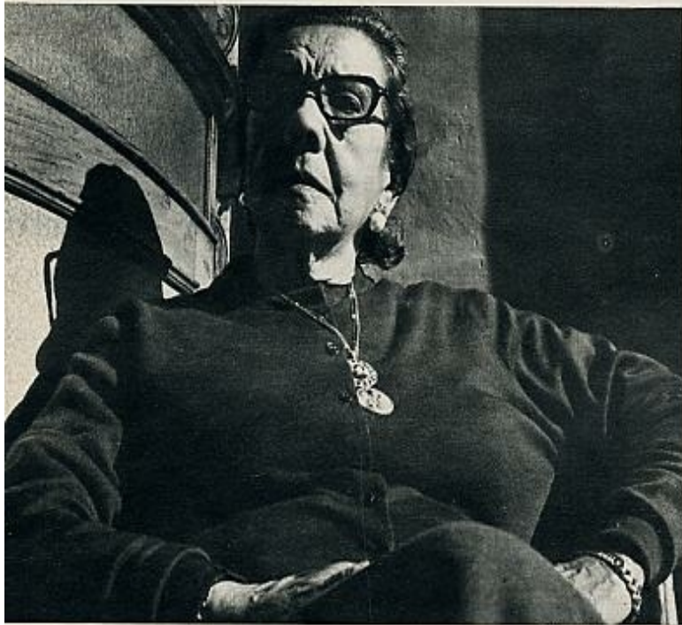
Pastora Pavón, la Niña de los Peines, en la actualidad. Se trata, sin duda, de la más auténtica cantaora de nuestro tiempo. En ella se remansan los mejores estilos.

«Esgraciaito aquer que come er pan por manita ajena: siempre mirando a la cara si la ponen mala o güenas» (Martinete de Juan Pelao)