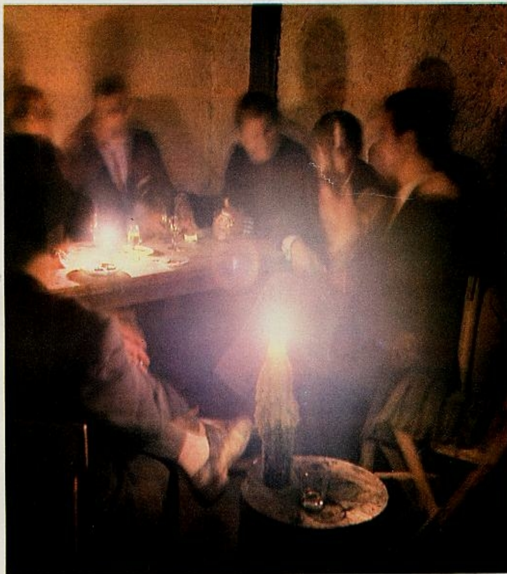
La «fiesta», contrapunto equilibrador. En la penumbra, espaciando las copas, se baila y se canta hasta consumir las fuerzas. Todos participan y son protagonistas, en la reunión en la que el «duenden» y el «ángel» se enfrentan en lucha.

—Mi padre no quería grabar discos. Le parecía que no estaba bien