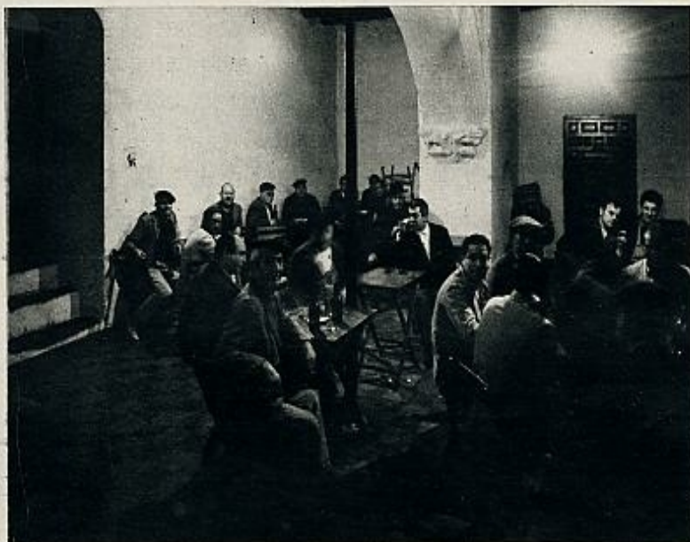
Utrera, famoso núcleo del cante a través de los años. En el viejo bar, El Perrate.