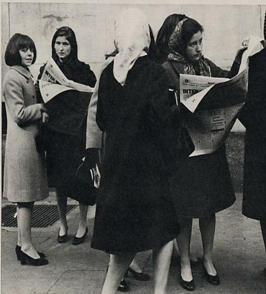
Las muchachas se resisten a admitir que las declaraciones del periódico puedan considerarse inmorales.