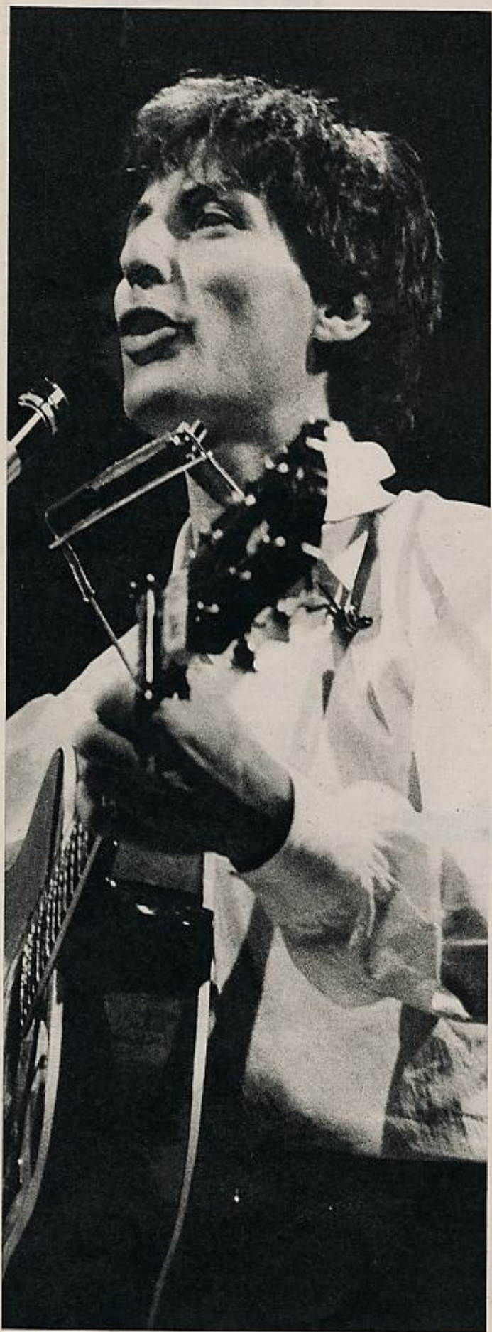
En una breve actuación —a continuación tenía que trasladarse al Olympia—, Hughes Aufray interpretó varias canciones compuestas por el americano Bob Dylan.