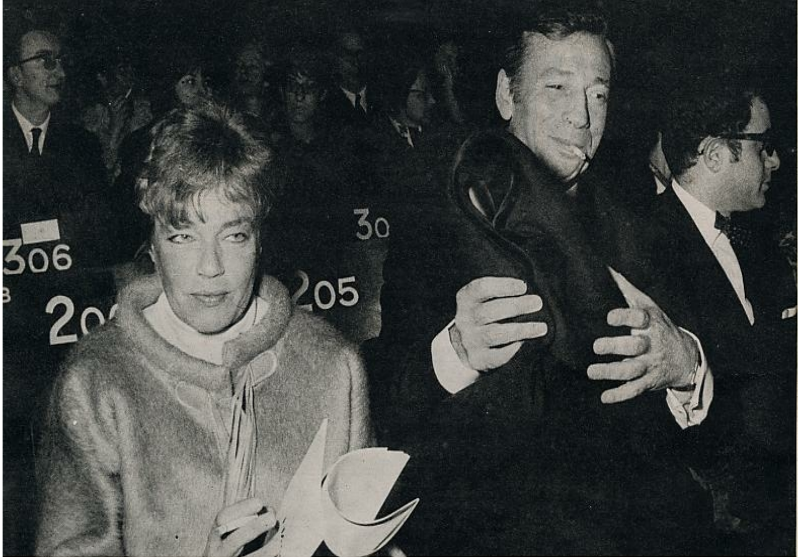
Yves Montand había presentado, después de la alocución del reverendo King, a los cantores que iban a intervenir en el espectáculo. Luego se reunió con su esposa, la sensacional Simone Signoret, que se hallaba entre el público. También se encontraba en la sala la temperamental Melina Mercouri, esta vez sin Jules Dassin.

Ferrat y Aufray, mujeres como Barbara y Anne Sylvestre están abriendo paso a este tipo de canción «comprometida».