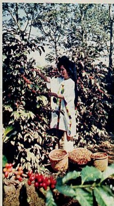
Plantación de café (recolección granos)