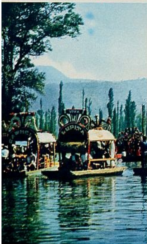
Jardines de Xochimilco (Méjico)

¡Para participar basta con las etiquetas y boletos de NESCAFÉ!