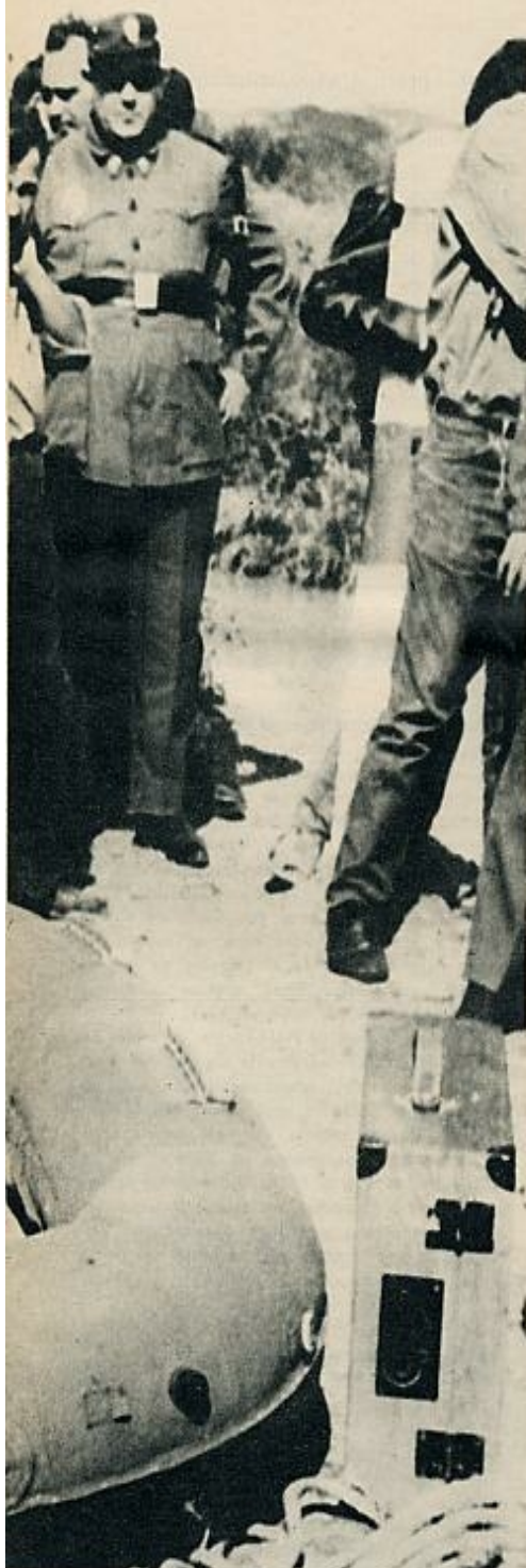
esperanza de encontrar aún vida o levantar los cadáveres.

cerca de un 3 por ciento de probabilidades de tener un accidente, de resultados imprevisibles, en los próximos meses de las grandes vacaciones.