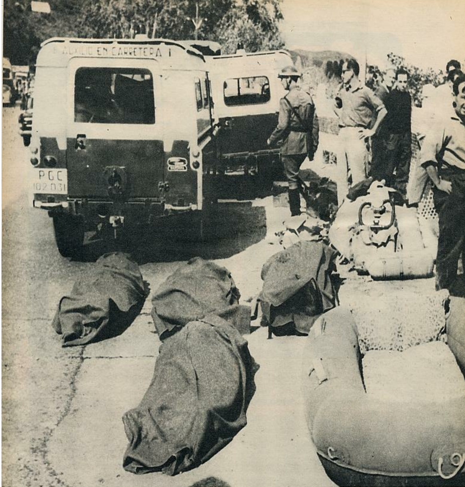
Los cuerpos ocultos por las burdas mantas cuarteleras yacen inmóviles al borde de la ruta. El cotidiano drama se ha consumado. El Auxilio en Carretera acude con la

D ENTRO de unos días, cuando junto abra la veda a la avalancha del turismo, millares de hombres solitarios o con la familia a cuestas se zambullirán ansiosamente en el reblandecido asfalto de las carreteras, en busca de lo detalladamente soñado durante el largo y trabajoso invierno: la arena y el mar, el sol, la montaña, la naturaleza.