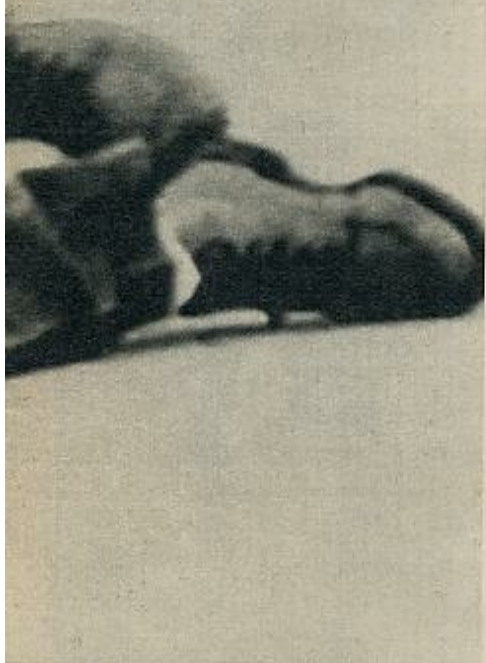
la joven esposa de Meredith; a la derecha, el agresor.