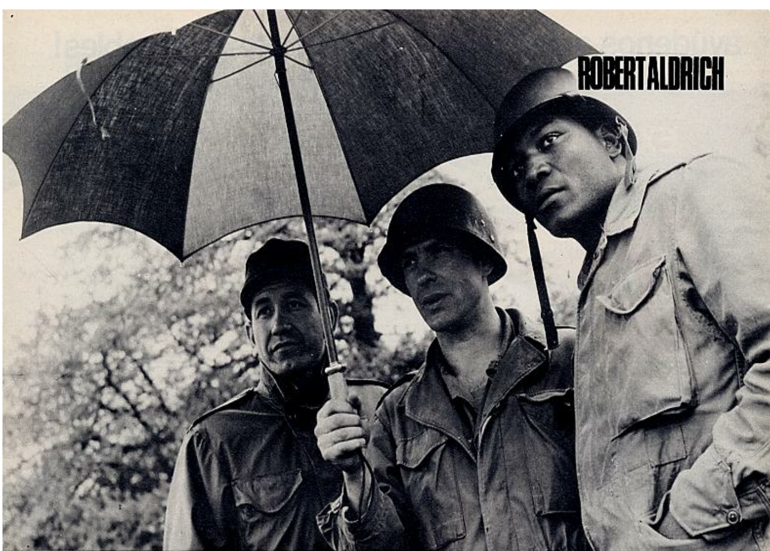
Un estupendo grupo de «segundos» acompaña a Marvin en el reparto del film. Arriba, a ambos lados de John Cassavetes, dos figuras populares en otros terrenos y hoy pasadas al cine: el cantante Trini López y el futbolista de color Jim Brown. Abajo, frente al protagonista, Ernest Borgnine, Oscar 1956 por su labor en «Marty».