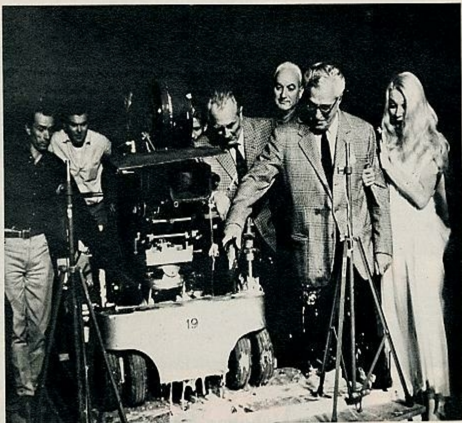
Vittorio de Sica prepara el plano que se va a rodar. Shirley Mac Laine observa atentamente los preparativos de la escena que luego interpretará ella: una especie de parodia de la Danza de los Siete Velos...