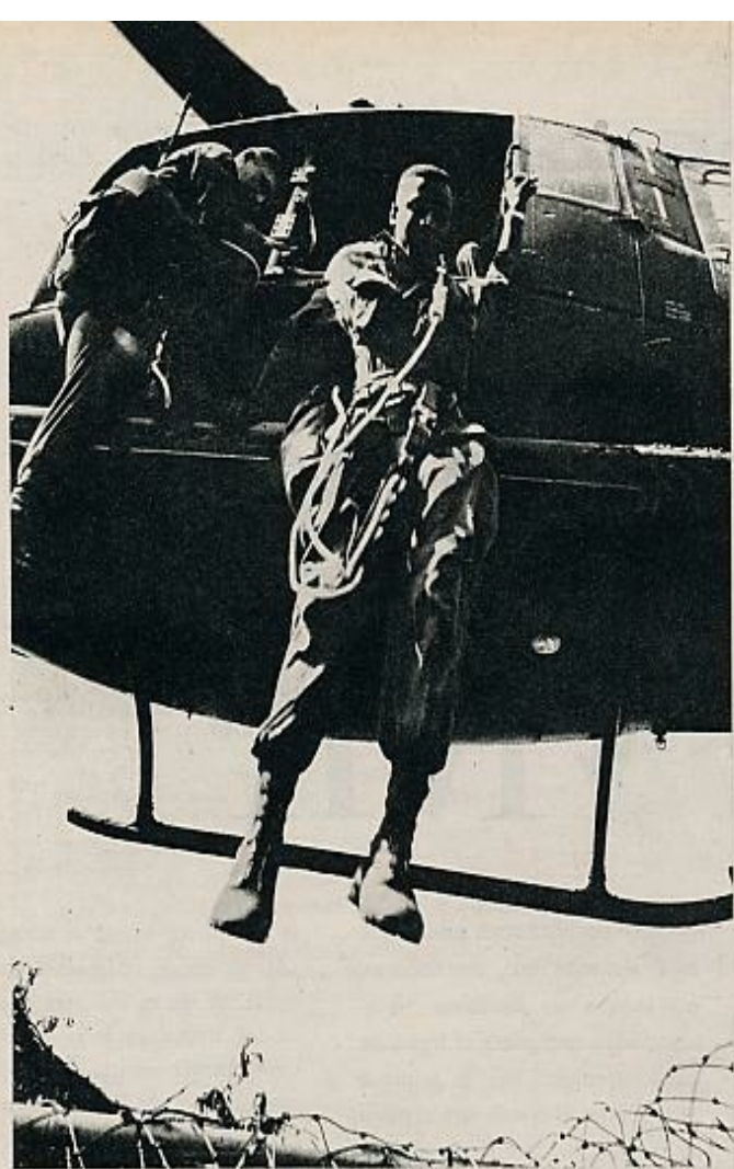
Sobre ella saltarán los soldados, que luego se deslizan fácilmente al suelo, a través de de manejo muy sencillo. En la foto de abajo, derecha, una sesión de entrenamiento.