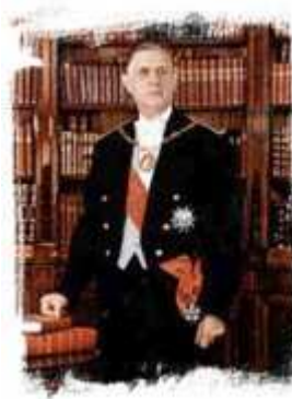
Charles De Gaulle

“Cuando se trata de Europa y cuando se intenta discernir lo que ella debe ser, hay que representarse siempre lo que es el mundo.