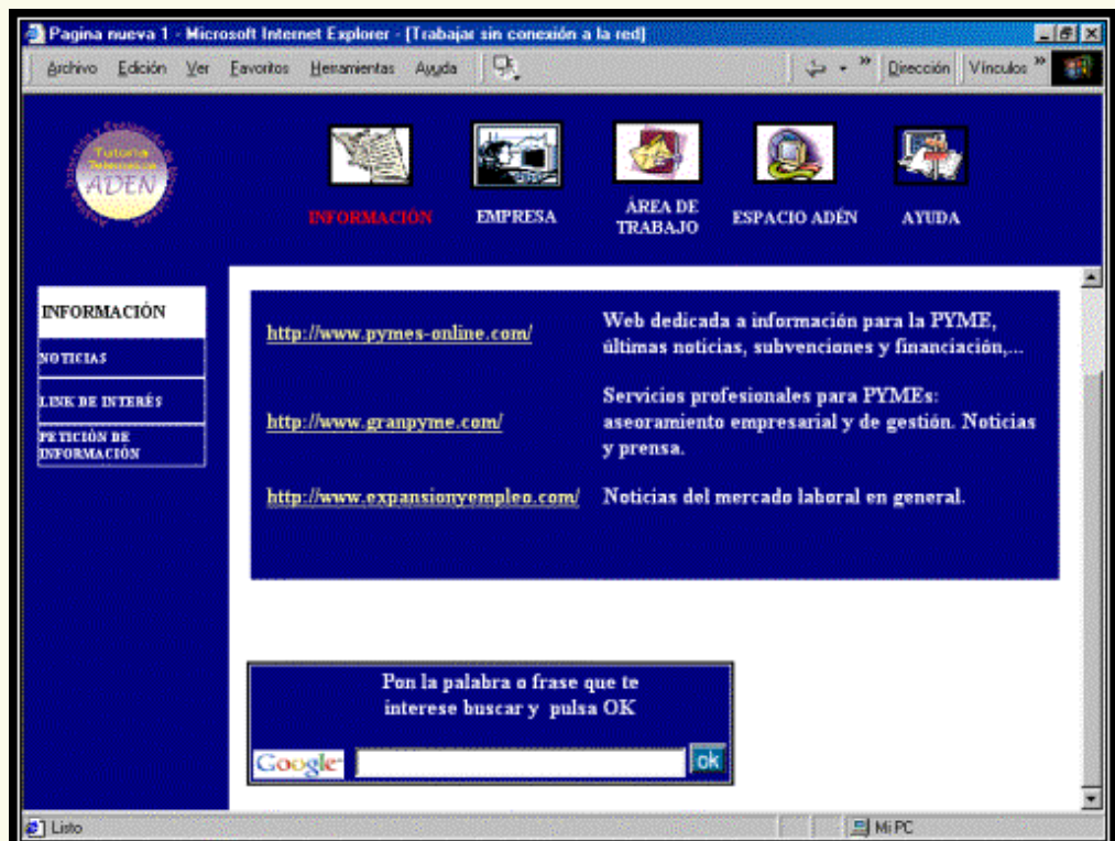
Figura 4: Unidad de Información. Link de Interés.

Esta unidad ofrece un conjunto de informaciones de diversa índole en relación con el mercado del sector correspondiente, tanto noticias propiamente específicas, hasta enlaces a otras páginas donde se encuentra información útil y un buscador para que posibilite la exploración de aquella información que no se encuentre en la web. Para todo aquello que no encuentre y requiera, incluimos un formulario de petición de información específica que el tutorizado considere importante para su conocimiento. El fin último de esta unidad es que el tutorizado conozca el sector y el tipo de empresa en que trabaja y actualizar sus conocimientos sobre ambos.