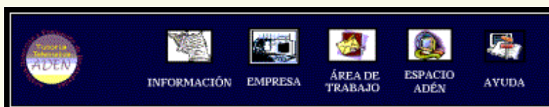
Figura 2: Menú Principal de Navegación de la Tutoría A.D.E.N.

Los tres caminos que constituyen la Tutoría A.D.E.N. se han organizado en cinco unidades temáticas básicas de funcionamiento que conforman el índice temático, apareciendo siempre visible como menú de navegación, evitando que el usuario se pierda por las páginas y permitiendo así el máximo aprovechamiento de la sesión de tutoría y la rápida habituación a la navegación. Igualmente, todos los hipervínculos son a no más de 3 niveles por este motivo. Con este fin también se ha creado una de las unidades temáticas: “Ayuda”, similar para los tres usuarios, donde además de establecer el mapa de navegación adaptado para cada uno de ellos, da información precisa sobre la filosofía del diseño y los botones principales de navegación.