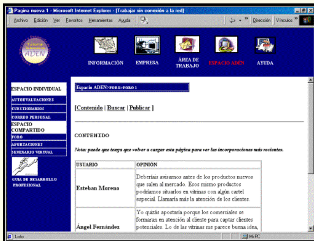
Figura 6: Unidad Espacio ADEN. Foro general.

. Foro General: Espacio de compartición de ideas, información y conocimientos, guiado por el tutor, que permite la recogida de información y la participación de todos los miembros, el diagnóstico y las posteriores acciones formativas. Es un foro general en el que se podrán marcar los temas a tratar y donde podrán participar todos los tutorizados.