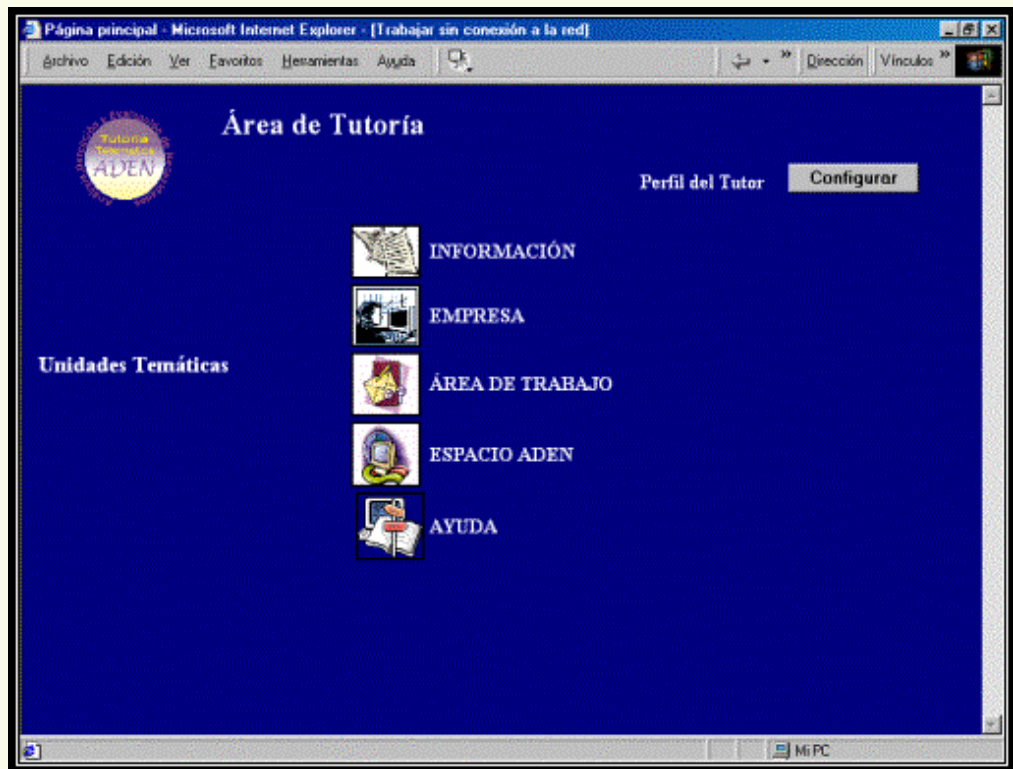
Figura 3: Página principal del Tutor. Área de tutoría.