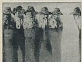
Galería Ramón Durán: Duarte.