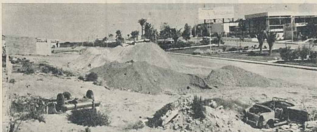
Las urbanizaciones infligirán una serie de injurias al Coto que serán acaso capaces de disminuir o dar al traste con aquellos valores que han sido utilizados como propaganda.

Pero dejando aparte la rentabilidad de tales cultivos e incluso suponiendo que ésta llegase a ser aceptable, quedarían planteados aún otros problemas: el agua que se utilizase para el riego sería la extraída de los mantos freáticos (de donde también la sacan las urbanizaciones), cuya evolución ante semejante sangría, dado que no han sido suficientemente estudiados, es científicamente imprevisible, y tanto puede no ocurrir nada apreciable, como puede secarse la marisma o acabar sien-