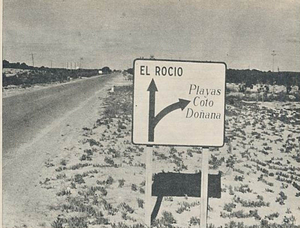
El famoso Coto de Doñana se utiliza como reclamo para atraer compradores («viva usted en pleno Coto de Doñana»), y en las señalizaciones viarias, las playas aparecen rotuladas con el nombre del Coto...

En 1969, una parte de Doñana fue declarada Parque Nacional porque, según palabras del legislador, «en nuestro país, afortunado precursor de esa inclinación hacia la conservación de los recursos naturales, resulta sumamente necesario prestar la máxima atención a aquellos lugares cuyas características especiales aconsejen conservarlos como ejemplo vivo de lo que es y significa la Naturaleza». Sin embargo, y a pesar de tan encomiables propósitos, la realidad de Doñana