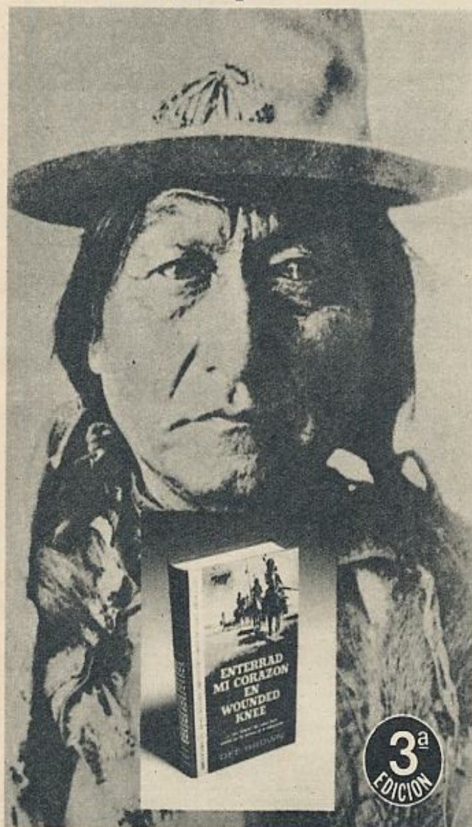
Foto real de SITTING-BULL (Toro Sentado) asesinado el 15 de Diciembre de 1890