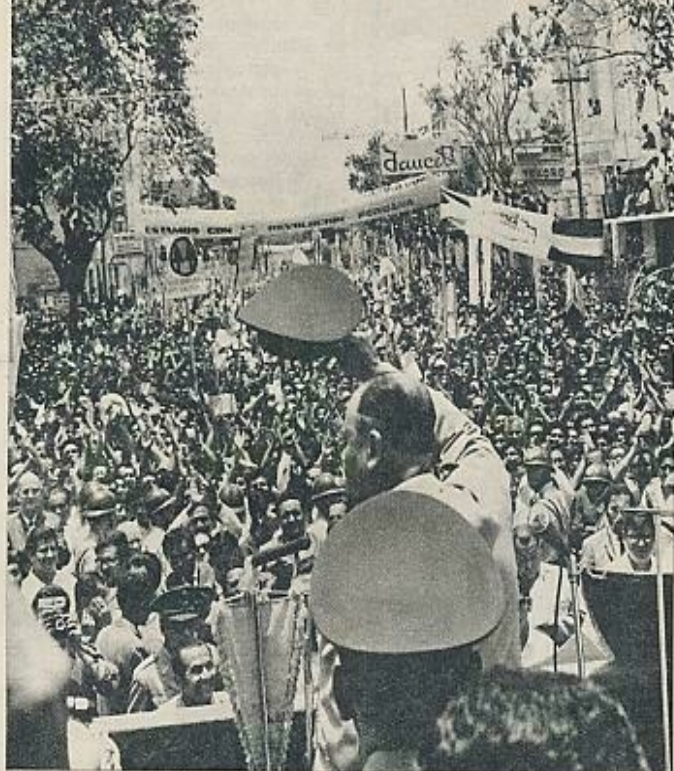
De espaldas, el Presidente Velasco Alvarado saludando al pueblo en el primer aniversario de la nacionalización de los pozos de petróleo de La Brea y Pariñas.

—Cuando la derecha creyó que este Ejército les estaba limpiando el piso, se encontró con que después de culminar la operación guerrillera, que fue muy rápida, el