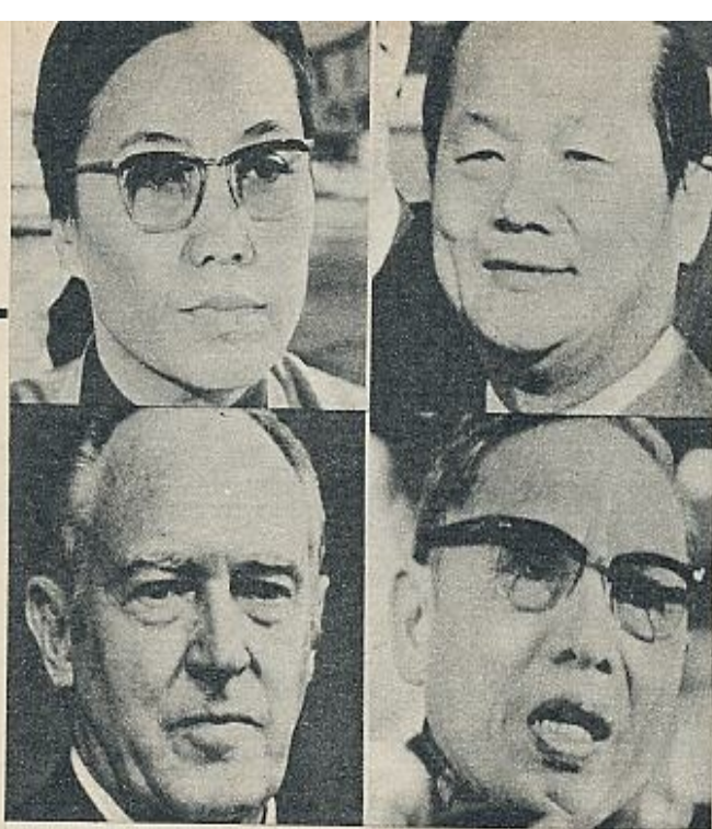
De izquierda a derecha y de arriba a abajo, la señora Nguyen Thi Binh (representante del Gobierno Revolucionario Provisional), Tran Van Lam (del Vietnam del Sur), William Rogers (USA) y Nguyen Duy Trinh (Vietnam del Norte, designatarios fundamentales del Acuerdo).

La página del Acuerdo donde se han estampado las firmas.