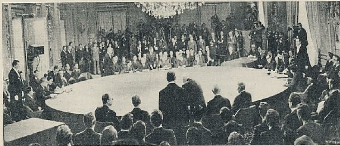
Firma del Acuerdo de Alto el Fuego, en el Centro de Conferencias situado en la avenida Kleber, París.

A pesar de su retirada militar, los Estados Unidos parecen tener planes políticos —y quizá los hayan expuesto ya en la URSS, quizá en Pekín— para estar presentes en la posguerra. La idea de contribuir económicamente para reparar y restaurar lo que previamente han destruido es explícita. Cuesta trabajo no pensar que esta contribución económica no tenga condiciones políticas. Kissinger, en su declaración anunciando el armisticio, ha hablado de que la futura misión de los Estados Unidos es la de «absorber el enorme talento y tenacidad del pueblo de Indochina en las tareas de reconstrucción, mejor que en las de destrucción». El profesor Huntington —a quien se describe como muy pró-