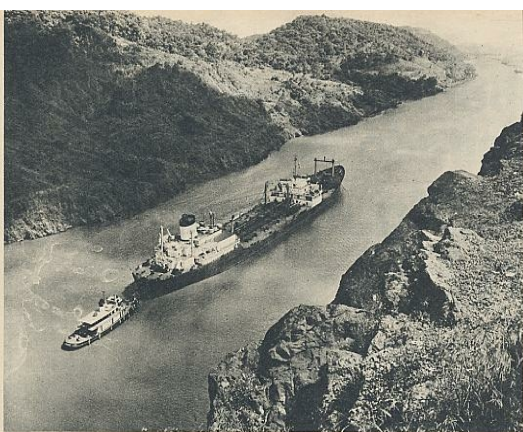
Un barco navega el Canal en la zona de costa Galliard.