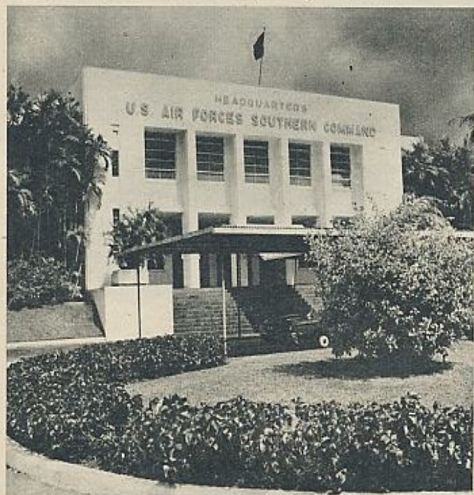
Edificio del cuartel general de la Fuerza Aérea de Estados Unidos (Comando Sur), con asiento en Albrook, en la Zona del Canal.

Ante la creciente indignación popular, el Presidente Roberto Chiari se vio obligado a suspender las relaciones con Estados Unidos y denunciar la masacre