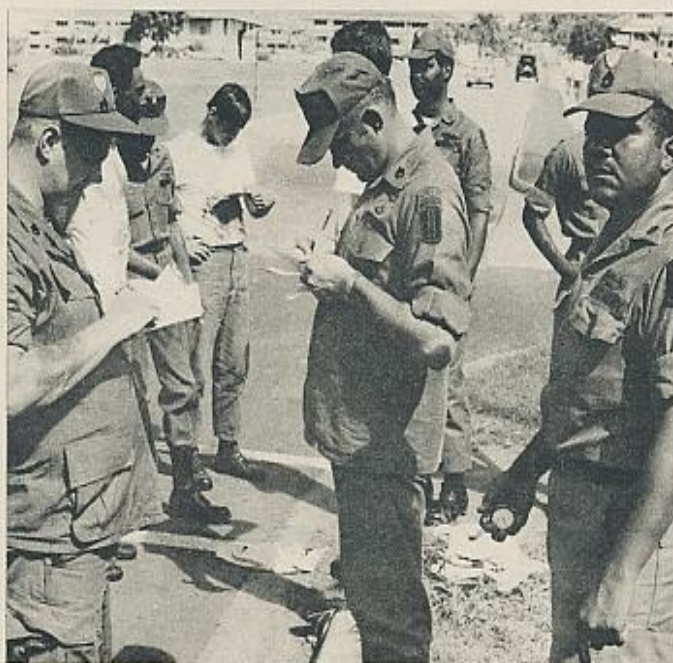
Tres instructores norteamericanos de la escuela antiguerrillera de Fort Kobbe, una de las 15 bases que Estados Unidos detenta en la Zona del Canal.

«El Gobierno norteamericano —dice la Cancillería panameña—, sin consultar ni informar a Panamá, ha hecho grandiosas ins-