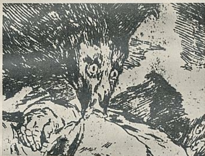
Drácula se apodera del alma de las mujeres chupando su sangre, con su aspecto humano o transformado en un gran murciélago.

La muerte de Drácula, en la que participan activamente todos sus perseguidores, puede interpretarse, pues, siguiendo los postulados de Freud, como la muerte del padre a manos de sus propios hijos. Incluso las consecuencias psicológicas del parricidio son similares. Freud señala que el asesinato origina el nacimiento de fuertes sentimientos de culpabilidad, pues, aunque el padre es profundamente odiado por los hijos, es al mismo tiempo amado y respetado por ellos. Leemos en la novela, después