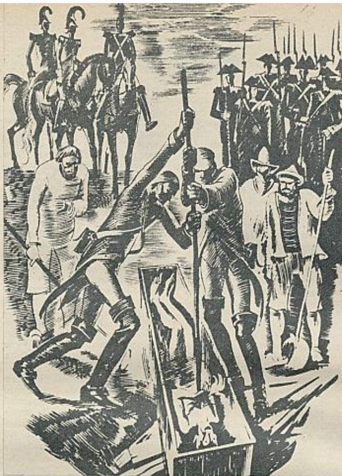
Un grabado moderno en el que se representa el modo tradicional de dar muerte a los vampiros, es decir, mediante una estaca que se hunde directamente en el corazón.

La vampírea sintetiza una serie de rasgos supuestamente antinaturales, con los que se ha tachado siempre a las mujeres que se han rebelado contra los imperativos que les imponían las sociedades patriarcales. Es continuadora, en este aspecto, de la tradición representada por las bacantes, las amazonas y demás regímenes matriarcales en los que el hombre tiene idéntico «status» subordinado que el de la mujer en sociedades de tendencia patrifocal. Con todo, con quien encontramos un mayor número de similitudes es con la figura de la bruja medieval. Modernos estudios sobre brujería de pueblos primitivos actuales ponen de relieve el hecho de que los movimientos de caza de brujas y la supuesta proliferación de las mismas se dan en épocas de cambio social, en el que las mujeres consiguen algunos nuevos derechos, que son vistos por los varones, consciente o inconscientemente, como una amenaza a su propia seguridad y «status» privilegiado. Según la feminista Eva Figues, el individuo que domina a las mujeres sólo puede admitir otra opción: ser dominado por ellas. Para evitar esta se-