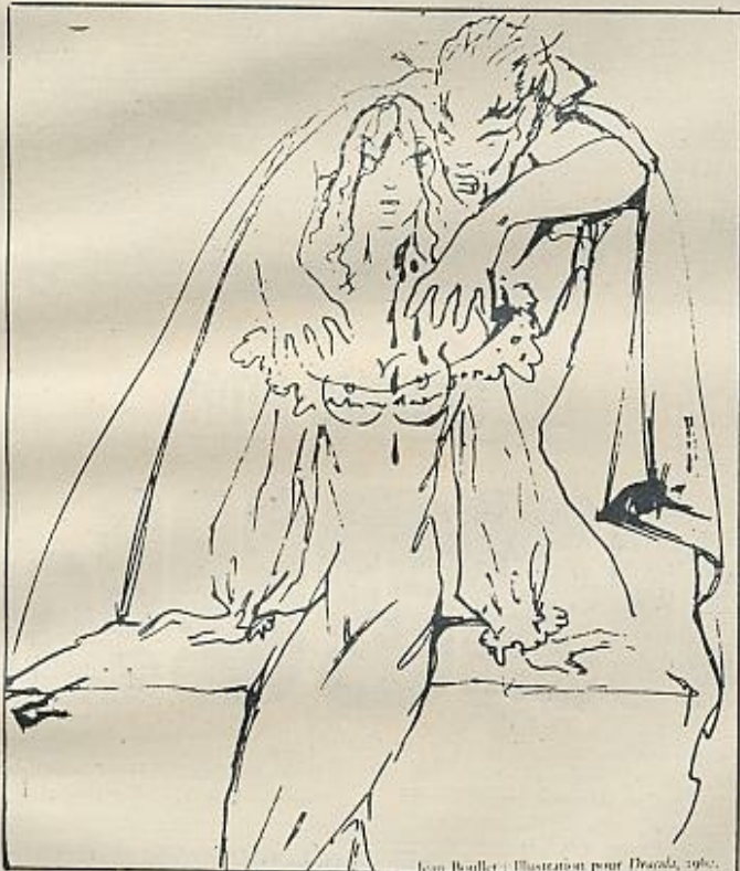
No es difícil adivinar que las «chupadas de sangre», a las que tan aficionado es el conde, disimulan una relación sádico-erótica (ilustración de Jean Boulet).

Las dulces, puras, bellas y encantadoras protagonistas de la novela no paran de repetir que el más sagrado deber de toda mujer es admitir su propia insignificancia y la subordinación más total y des-