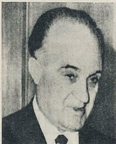
Andrutsópulos ha sustituido a Markezinis como primer ministro.