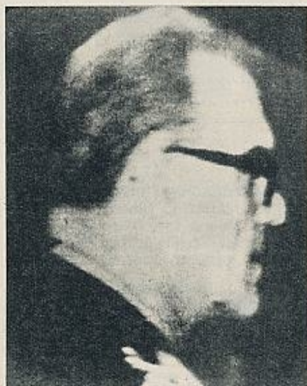
El teniente general Phantom Gizikis, un hombre duro.

A L volver al punto de partida, al volver a 1967 —y no olvidemos que ni en la vida humana, ni en la política, ni en la histórica se regresa nunca a un punto de partida: solamente se imitan o mimetizan situaciones pasadas que son irreproducibles, aunque sólo fuese por el hecho de que han sucedido ya, sin contar con todas las acumulaciones posteriores—, teóricamente Grecia se sitúa en unas condiciones que los propios conservadores en el poder habían tenido que desechar porque no servían. Si la situación estaba podrida como consecuencia de todo ello, no ofrece ahora garantías nuevas de que deje de estarlo.