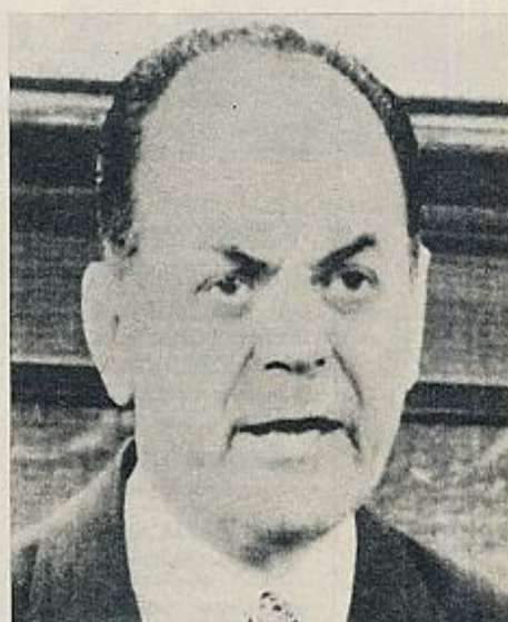
El general Papadópulos, «alguacil alguacilado».