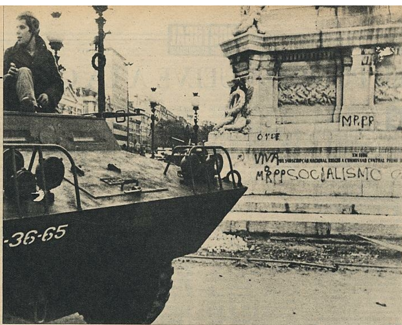
En monumentos y muros han aparecido estos días numerosas pintadas con «slogans» y siglas de partidos que hasta el momento del golpe se habían movido en la clandestinidad.

sólo será válido para la verdadera reconstitución del país si abarca a un máximo número de electores y de candidatos, de elegibles. Habrá unos redactores de la Constitución futura, que la someterán a la Constituyente, y ésta deberá tener un mecanismo lo suficientemente práctico como para elaborar las enmiendas necesarias.