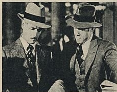
«El golpe» («The sting», 1973), de George Roy Hill.

todo puede ser mentira, si lo que en un momento se nos da como cierto ya no lo es unos minutos después por arte de birlibirloque, podemos jugar con el público cuando, cuanto y hasta donde nos venga en gana. Lo válido sería mantener su atención sin engañarle, sin tiro-