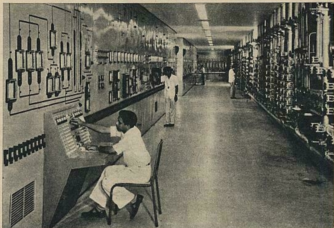
Interior de la galería central de la planta de plutonio de la central de Trombay.