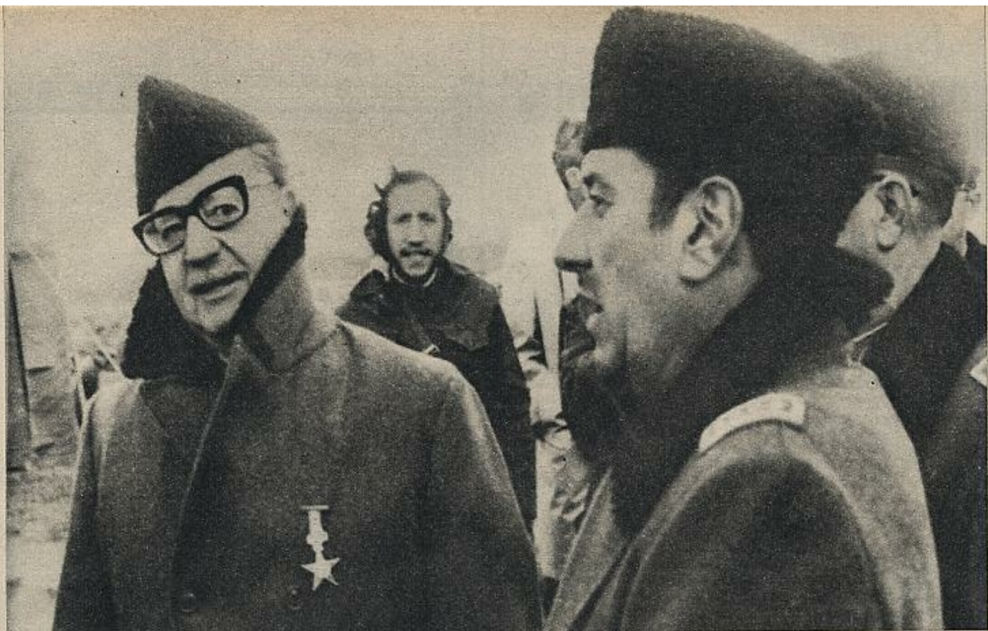
Prats: «Yo respetaba mucho a Allende y admiraba su honestidad y rectitud». En la foto, el general Prats con Allende durante un recorrido por Punta Arenas, la ciudad más meridional de Chile, en 1971.