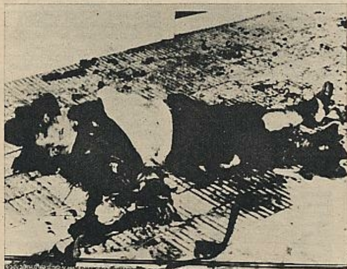
Prats ha muerto asesinado como su antecesor, el general René Schneider.