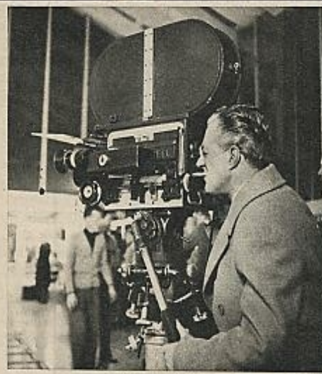
Vittorio de Sica.

Completando este ciclo informativo se estreña también en los cines españoles una de las últimas obras de este director: «¿... Y cuándo llegará Andrés?» (película que, entre otras cosas, fue la anunciada en el cine Amaya, de Madrid, cuando se anunció la retirada de «La prima Angélica»).