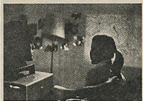
«Lola, Paz y yo», de Miguel Ángel Díez.

No hay que lanzar, sin embargo, las campanas al vuelo. Ni «Lola, Paz y yo» desmiente el valor de otros cortometrajes anteriores, ni propone la única fórmula posible de acercamiento a nuestra realidad.