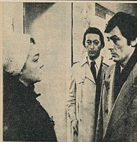
«Granjas ardientes» («Les granges brûlées», 1973), de Jean Chapot.

en imágenes. De Rose, por ejemplo, se nos dice que «es un personaje de novela», cuando no vemos más allá de un tipo común, con ciertas dosis de autoridad y dominio sobre su marido e hijos ni especialmente resaltadas ni resaltadas.