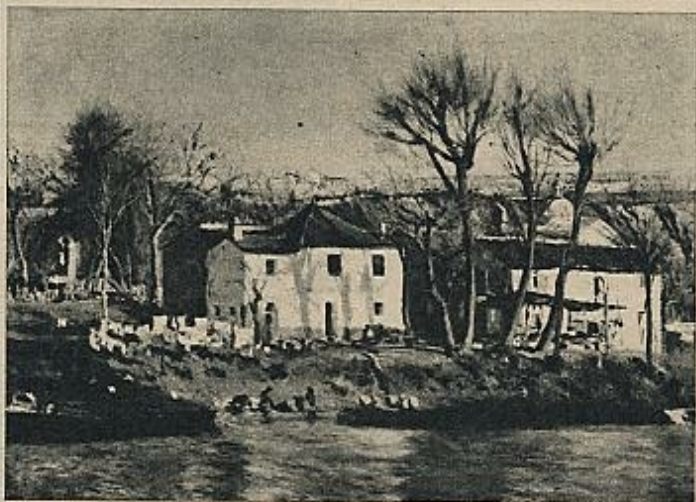
Aureliano de Beruete: «Arboles del Manzanares».