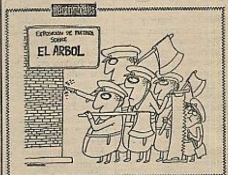
«Ideal»: miércoles, 3 de julio de 1974.

ni a las madres lacrimógenas, ni a las mozas con cántaros. Se refiere a algo que implica paisaje. Y hay que tener en cuenta una cosa: El paisaje —claro— ya se realizaba en la pintura española, pero fue en torno a esa fecha cuando se generalizó, cuando nació un paisajismo sistemático. La realización sistemática del paisajismo ya significaba por lo menos una cosa: el abandono del anecdotismo sistemático por la adopción de una pintura que —no se olvide de que ése era un tiempo impresionista—, por