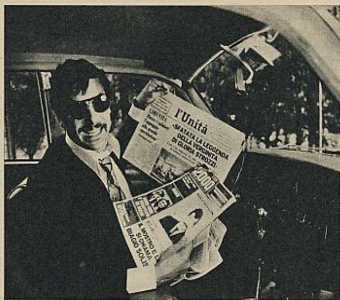
«He sido yo» («Sono stato io», 1973), de Alberto Lattuada.