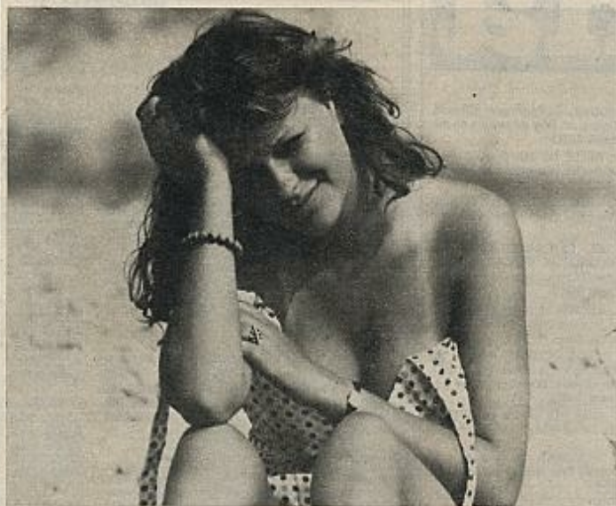
«Pleure pas la bouche pleine», de Pascal Thomas (1973).

En «Pleure pas...», el joven cineasta francés —que ya ha estrenado su tercer largometraje, «Le chaud lapin», todavía no llegado a España— desarrolla un esquema similar al de los «cuentos morales» de Rohmer, nada más que cambiando de masculino a femenino en cuanto a protagonista y dándole una resolución no ortodoxa ni determinada por las reglas de comportamiento al uso, una vez que los tres miembros del triángulo se complementan entre sí, en vez de quedar excluido uno de ellos, a la manera del autor de «Ma nuit chez Maud». Es la solución lógica, ya que Thomas no nos sitúa ante seres cuyo desarrollo vital venga condicionado por unas normas preestablecidas, sino todo lo contrario, que se van haciendo a sí mismos en cada momento, sorprendiéndonos muchas veces de sus