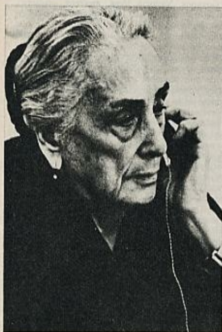
Dolores Ibárruri, «La Pasionaria».