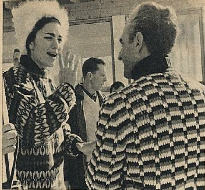
El Sha detenta sobre el país un poder absoluto, con la única e insignificante contrapartida de la Asamblea Nacional, que dirige el partido Nuevo Irán. (En la foto, el Sha acompañado de su esposa, en una estación invernal austriaca.)

La "Gran Civilización", sueño del Sha, supone una sociedad ideal basada en la mayor justicia social posible y que excluya el ocio y la holgazanería. Parte importante de la teoría es la idea de que las potencias occidentales han entrado en un período de decadencia, motivado por la "permissividad" del ciudadano capitalista, que es definido como "quien pide más y más a cambio de menos trabajo". Ante la inmediata oportunidad histórica del Irán, el país se prepara para, en un plazo de cinco años, alcanzar el poderío político y militar de las grandes potencias. Por otra parte, el grado de bienestar económico de los países occidentales habrá de ser alcanzado antes de veinticinco años.