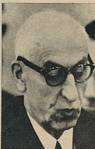
La caída del líder nacionalista Mossadeq, que gobernó al país entre 1951 y 1953, fue el resultado de una de las más brillantes operaciones de la CIA y facilitó la entrada en el país de las compañías petroleras americanas.

Por otra parte, la actitud solidaria con los países árabes provoca una muy saludable simpatía, necesaria ante el incesante expansionismo en los regímenes conservadores del golfo. Pese al rechazo por parte de los regímenes revolucionarios árabes, la baza del petróleo es jugada al unísono con unos y otros. Todo esto no quita que, ante la eventualidad de un conflicto militar en el golfo, de inspiración y hechura americanas, sea el Irán el país destinado a encubrir o materializar la intervención yan-